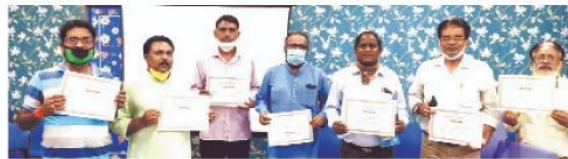
प्रशस्ति-पत्र के साथ एनजीओ कर्मी।

हैदराबाद और अपने घर आने में सहायता की घर आने में उनके घर पहुंचने सरकार की